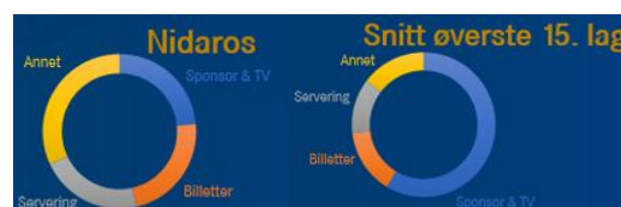
Figur 1 Kakediagram av inntektsfordeling

Utfordringen med inntektsgrunnlaget til klubben er at det kom inn for lite inntekter fra samarbeidspartnere de første 9 månedene. Det ble budsjettert med kontinuerlig inntektsstrøm fra signering av nye partnere, men dette arbeidet lyktes dessverre ikke. Fra September derimot har pilene pekt oppover og vi har sammen med SPOR-nettverket til Ski VM 2025 den raskest økende partnertilstrømmingen. Klubben ligger på ca. 25% av inntektsgrunnlaget fra partnere. Nasjonalt ligger i snitt de 15. største ishockeyklubbene i Norge på et forhold på ca. 50-60%. I snitt ligger også andre eliteklubber i Trondheim på samme forhold. Skal derfor Nidaros ishockeyklubb lykkes med å ta løftet og kjempe i toppen av norsk ishockey må vi bli enda bedre på å få med samarbeidspartnere.